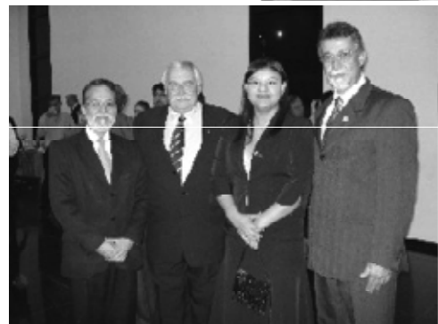
Médicos na fundação da FEMAM

O último bimestre foi agitado para os diretores do Sindimed em razão de compromissos com entidades médicas de todo País.