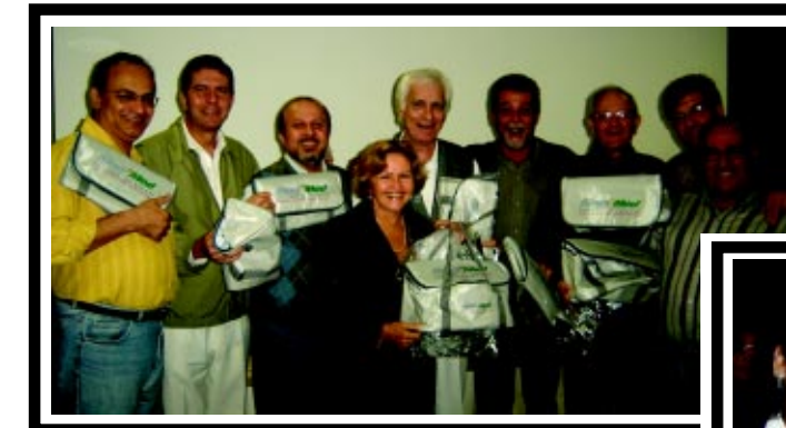
Aniversariantes de maio e junho comemoram data especial e ganham bolsa térmica, novo brinde do Sindimed