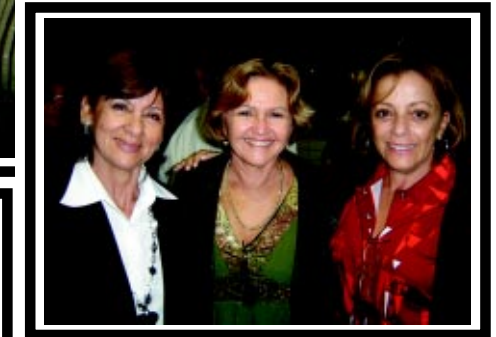
Mulheres participam da festa