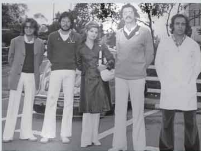
Aqui, nosso homenageado com os colegas da Faculdade de Ciências Médicas de Santos