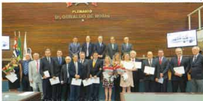
Os homenageados da noite