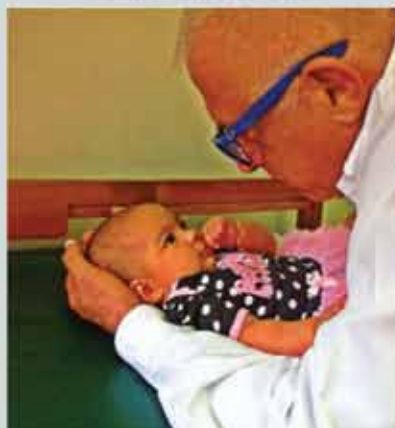
Dedicação e carinho no atendimento