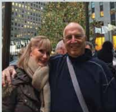
... em suas viagens de férias