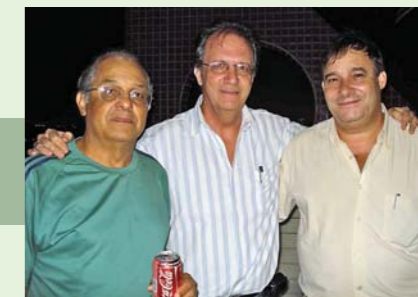
Médicos em momento de descontração