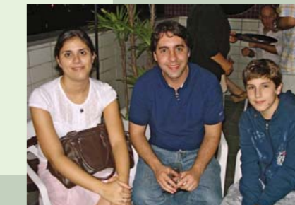
Família reunida na sede do SINDIMED