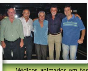
Médicos animados em festa