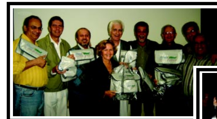
Aniversariantes de maio e junho comemoram data especial e ganham bolsa térmica, novo brinde do Sindimed