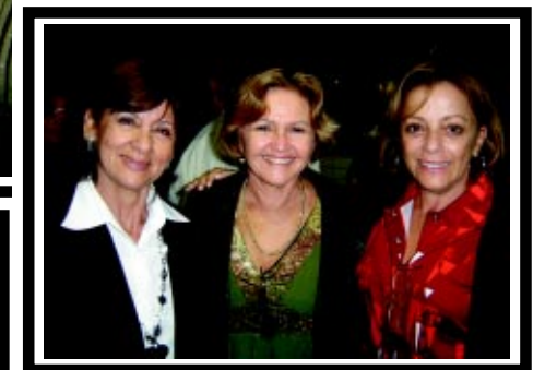
Mulheres participam da festa