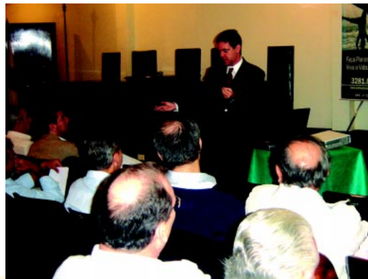
Palestra mostra avanço da saúde suplementar no Brasil