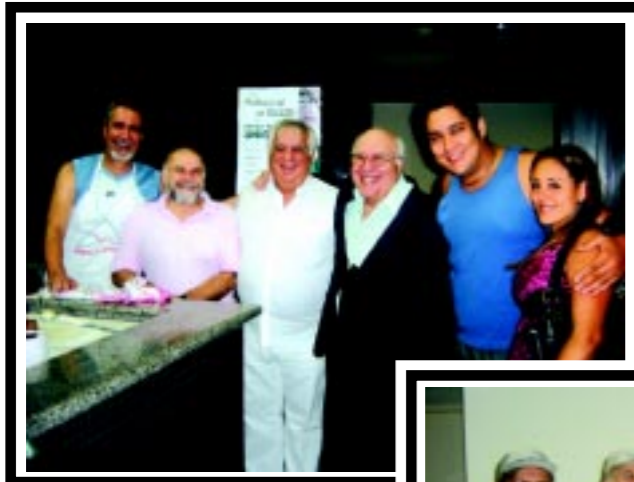
Clima de alegria durante comemoração no Sindimed