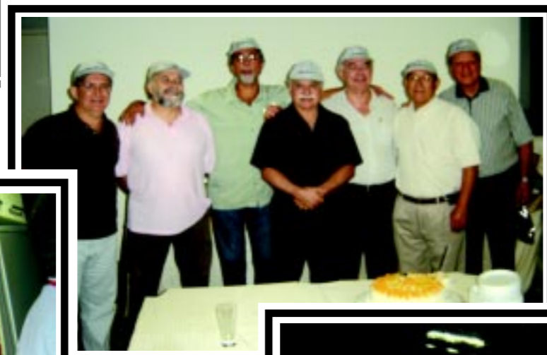
Aniversariantes de novembro e dezembro festejam aniversário