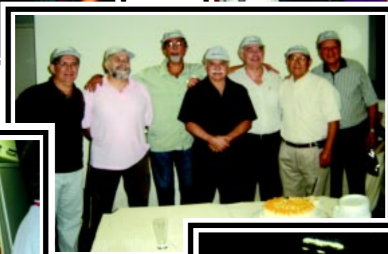
Aniversariantes de novembro e dezembro festejam aniversário