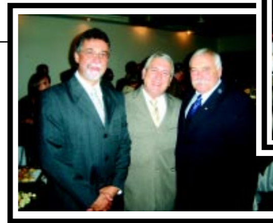
SINDIMED participa de comemorações do Dia do Médico na AMS