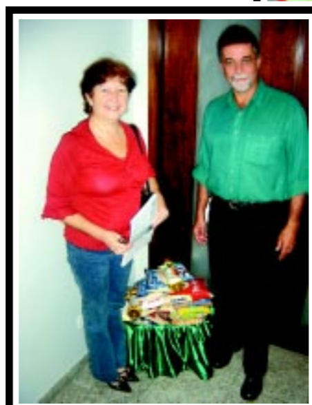
SINDIMED faz doação de alimentos à Casa da Vovó Benedita