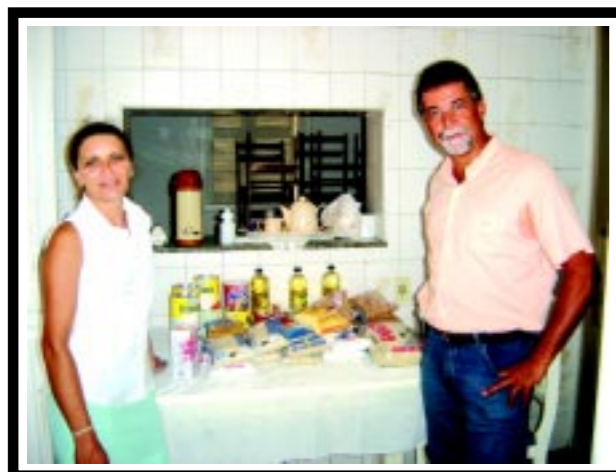
SINDIMED doa alimentos para Casa Caio

Confira os principais fatos que aconteceram neste ano no Sindimed