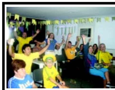
Sócios do SINDIMED assistem jogo da Copa na sede da entidade, com direito a telão e churrasco. Patrocínio da Litoral Farma e laboratório Eli Lilly do Brasil

- SINDIMED intervém em conflito na Praia Grande causado por alterações no sistema de plantão e resolve impasse.