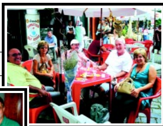
Médicos fazem passeio de um dia em Embu das Artes, organização do SINDIMED em parceria com LFTurismo