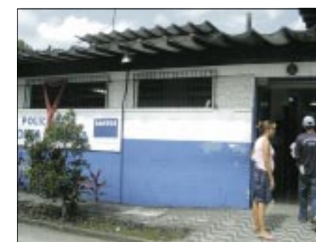
Membros do SINDIMED visitam policlínicas (foto), hospitais e prontos-socorros da Região

Inclusive, em setembro do ano passado, os dirigentes do SINDIMED esti-