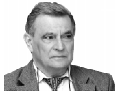
Meinão prioriza aprovação do PL 3466/04

O jurídico ressalta ainda que o entendimento jurisprudencial quanto à matéria tem entendimento pacífico, tendo em vista que se encontram os profissionais médicos alcançados pelos instrumentos coletivos de trabalho.