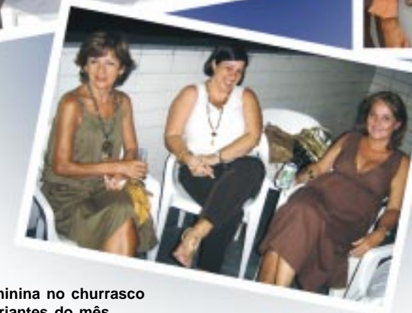
Presença feminina no churrasco dos aniversariantes do mês