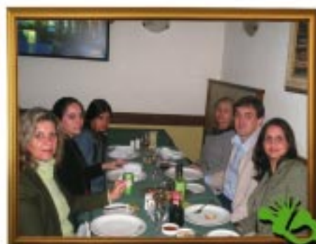
No ônibus, a caminho da peça "O Fantasma da Ópera" e momentos no restaurante Villa Tavola.