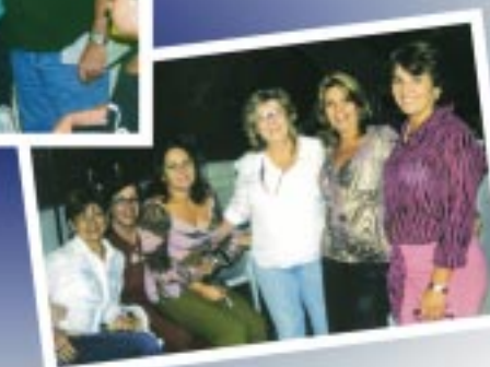
Mulheres marcam presença na festa de aniversariantes do mês