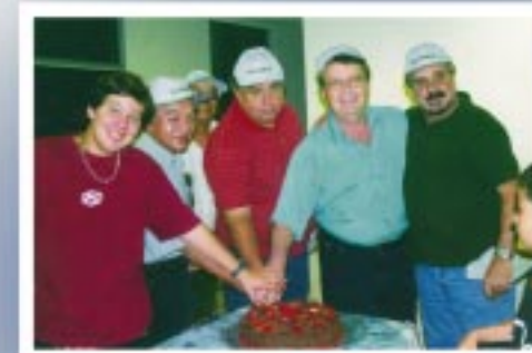
Aniversariantes de julho e agosto festejam data especial

Aproveitamos a ocasião também para lembrar todos os médicos da região da Baixada Santista que o jornal do Sindimed está de portas abertas para você sugerir pautas, entrevistados e emitir sua opinião. Enfim, queremos ver sua participação. Os e-mails devem ser encaminhados para o endereço eletrônico imprensa@sindimedsantos.org.br . Contamos desde já com a sua colaboração!