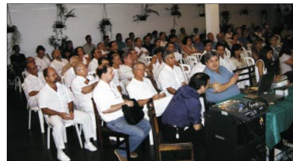
Classe médica elegeu piores planos de saúde e atendimento por reembolso às seguradoras continua

Outra decisão da assembléia é continuar o atendimento por reembolso às seguradoras e dar início às reuniões por especialidades para ver quem atende seguradoras por guia. E, a partir daí, encaminhar nomes ao Cremesp. "A Comissão