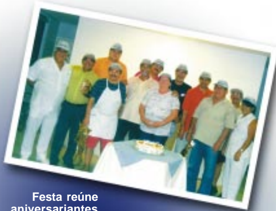
Festa reúne aniversariantes de março e abril