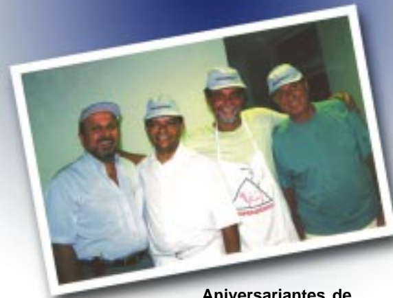
Aniversariantes de fevereiro comemoram data especial