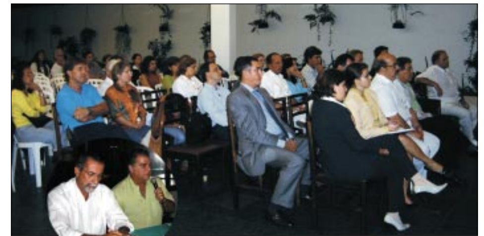
Médicos discutiram mudanças em reunião

va insatisfeita com as mudanças administrativas na Secretaria de Saúde, o Sindimed promoveu reunião na sede da entidade no dia 14 de abril para conhecer as queixas dos médicos e dentistas, lotando o auditório do sindicato. Entre as principais reclamações estavam a defasagem salarial, as péssimas condições de trabalho e a infra-estrutura das unidades de saúde.