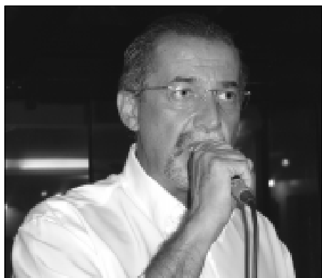
Presidente do Sindimed ressaltou a importância do projeto para a classe médica

Lei n. 3.820, de 11 de novembro de 1960 Art. 1º São funções privativas dos farmacêuticos (...) VI – Desempenho de outros serviços e funções, não especificados no presente decreto, que se situem no domínio de capacitação técnico-científica profissional.