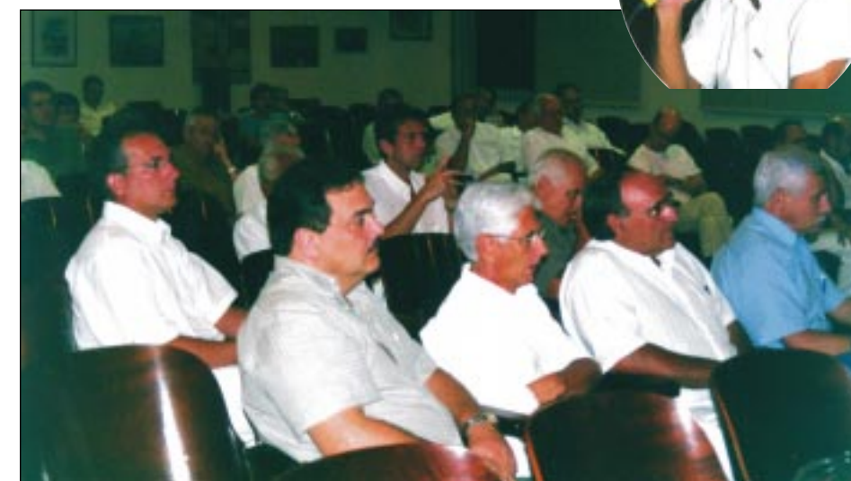
Médicos prosseguem atendimento por sistema de reembolso às seguradoras

cientizar os pacientes das seguradoras de saúde sobre a mobilização.