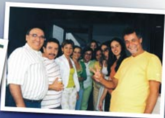
Almoço foi realizado em clima de descontração