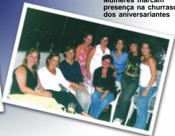
Mulheres marcam presença na churrascada dos aniversariantes