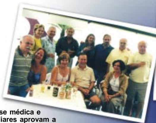
Classe médica e familiares aprovam a feijoada de fim de ano