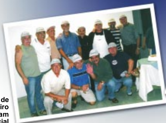
Aniversariantes de dezembro e janeiro comemoram data especial