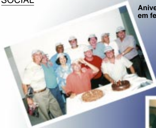
Aniversariantes de setembro em festa no Sindimed