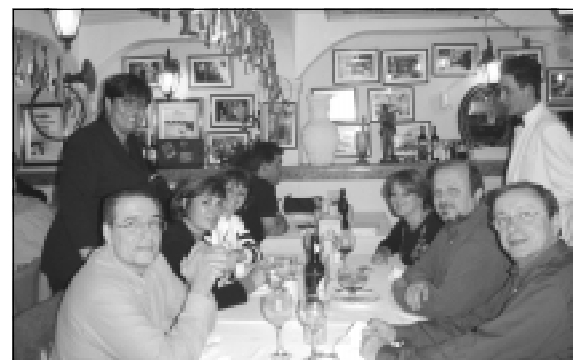
Passeio foi marcado pela descontração

Um calendário de trabalho está sendo organizado para o próximo ano. Estamos abertos a sugestões de programação, que podem ser enviadas para os e-mails: sindimed Santos@terra.com.br ; veronica.imprensa@uol.com.br ou pelo telefone 3223-8484.