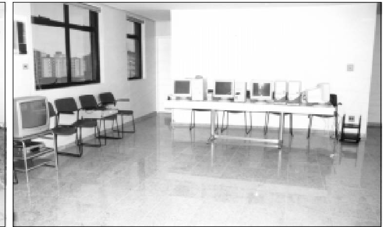
Piso que apresentava más condições foi trocado por granito