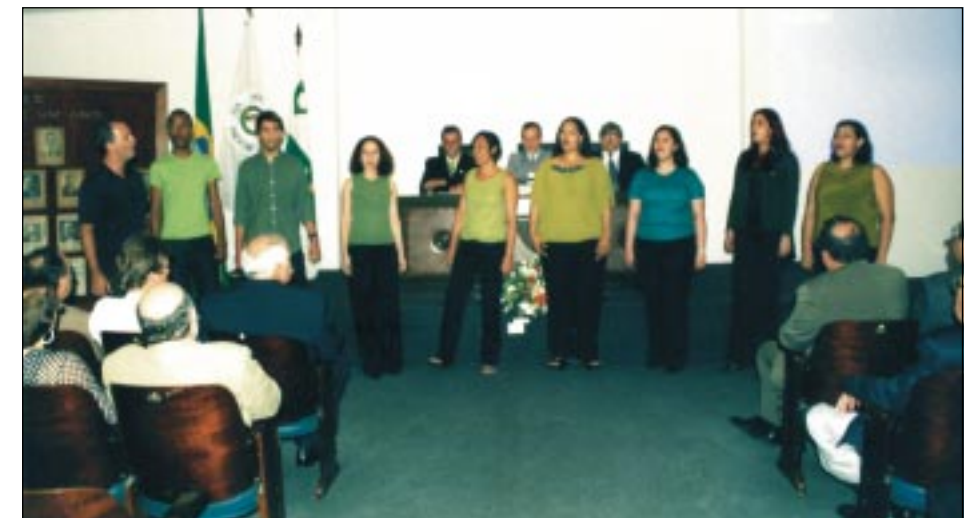
A apresentação do coral da AMS abrilhantou a comemoração