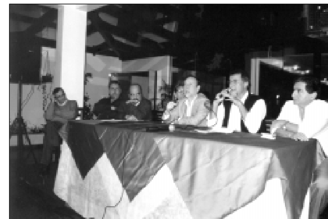
Em assembléia, médicos da Baixada Santista aceitaram proposta da Unidas

As denúncias podem ser feitas de segunda à sexta-feira, das 11h às 15h, pelo telefone (13) 3223-8486. Não é preciso se identificar.