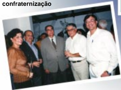
Médicos curtem confraternização