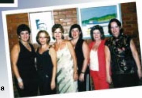
Esposas de diretores do Sindimed marcam presença na comemoração

Doutor , em nenhum banco você vai diagnosticar tantas vantagens .