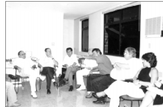
Comissão da Baixada Santista faz reuniões semanais para articular o movimento