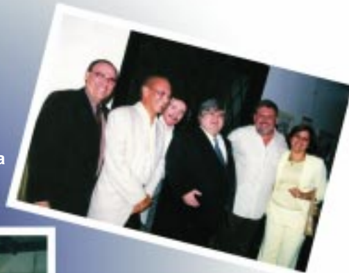
Data é comemorada com alegria pela classe médica