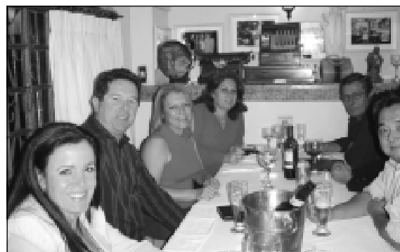
Após a peça teatral, a turma foi jantar na Lelis Tratoria

A montagem foi apresentada no Teatro FAAP, em São Paulo. A excursão partiu da porta do Hipermerca-